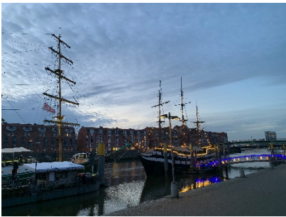
Bremen-An der Schlachte