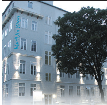
MEDIZINISCHE UNIVERSITÄT WIEN / © MedUni Wien

Betriebes und des Betriebes des Tierspitals sowie auf die Verpflichtungen der Medizinischen Universitäten und der Veterinärmedizinischen Universität Wien im Bereich des Gesundheitswesens und des Veterinärwesens Rücksicht zu nehmen.