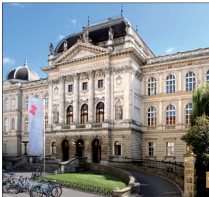
TECHNISCHE UNIVERSITÄT GRAZ, HAUPTGEBÄUDE, ALTE TECHNIK

Kindes oder im Fall von Mehrlingsgeburten seiner Kinder bis längstens zum Ende des Beschäftigungsverbotes der Mutter gemäß § 5 Abs 1 und 2 MSchG, gleichartiger österreichischer Rechtsvorschriften oder gleichartiger Rechtsvorschriften der Vertragsstaaten des Abkommens über den Europäischen Wirtschaftsraum ein Urlaub unter Entfall der Bezüge (Karenz) im Ausmaß von bis zu vier Wochen zu gewähren, wenn er mit dem Kind (den Kindern) und der Mutter im gemeinsamen Haushalt lebt und keine wichtigen dienstlichen Interessen entgegenstehen.