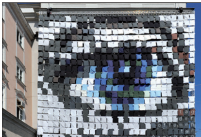
KUNSTUNIVERSITÄT LINZ (EYECATCHER – FASSADENGESTALTUNG ZUM TAG DER OFFENEN TÜR 2010)

einer Gesamtdauer von vier Jahren. Auf diese Gesamtdauer sind nur die tatsächlichen Vertragszeiten anzurechnen, die nach dem 30. 9. 2007 zurückgelegt wurden.