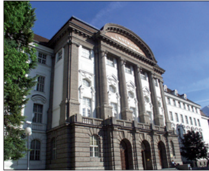
UNIVERSITÄT INNSBRUCK / © Universität Innsbruck

Qualifikationskriterien, die typischerweise für die Erfüllung des arbeitsvertraglich festgelegten Aufgabenbereiches notwendig sind, finden keine Berücksichtigung. Qualifikationskriterien, die bereits bei einer Zuerkennung des Expert(inn)enstatus berücksichtigt worden sind, können für eine weitere Zuerkennung nur dann anerkannt werden, wenn sie auch nach der vorhergehenden Vorrückung neu erfüllt sind. Das ist insbesondere der Fall, wenn organisatorische oder inhaltliche Änderungen des Tätigkeitsprofils neue Qualifikationen erfordern.