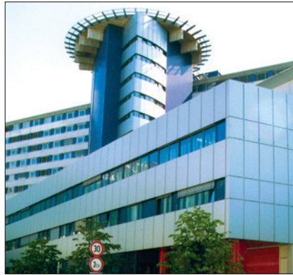
MEDIZINISCHE UNIVERSITÄT INNSBRUCK, CHIRURGIE

(1) Eine Dienstreise liegt vor, wenn sich der/die ArbeitnehmerIn zur Ausführung eines von der Universität erteilten Auftrages eine Wegstrecke von mindestens drei Kilometer von seiner/ihrer Arbeitsstätte entfernen muss.