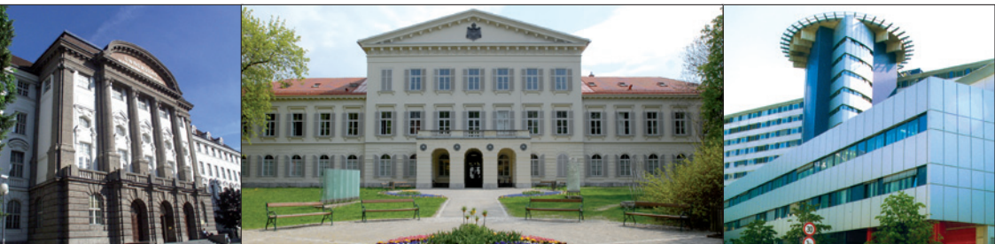
UNIVERSITÄT INNSBRUCK • KUNSTUNIVERSITÄT GRAZ, PALAIS MERAN • MEDIZINISCHE UNIVERSITÄT INNSBRUCK, CHIRURGIE