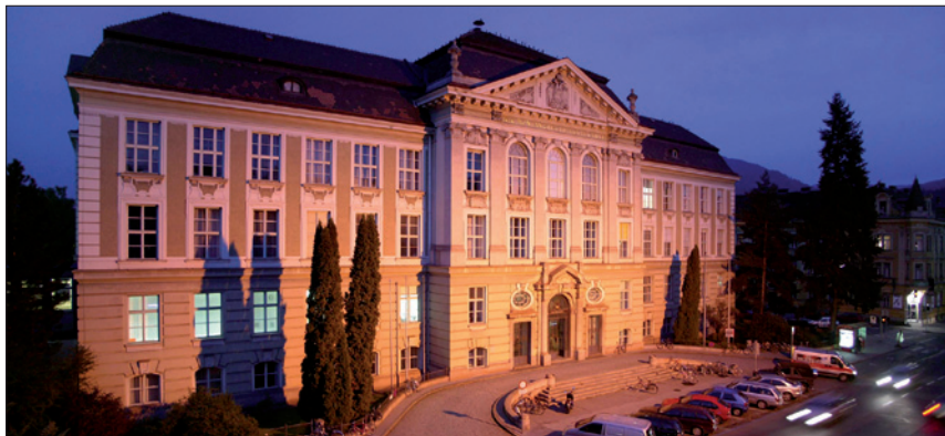
MONTANUNIVERSITÄT LEOBEN / © Montanuniversität/Freisinger

Ausmaß dieses Anspruches können durch Betriebsvereinbarung geregelt werden.