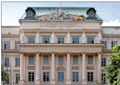
TECHNISCHE UNIVERSITÄT WIEN, HAUPTGEBÄUDE © TU Wien

(2) Haben ArbeitnehmerInnen unverfallbare Anwartschaften erworben, haben sie bei Beendigung des Arbeits- oder Ausbildungsverhältnisses vor Eintritt des Leistungsfalls Anspruch auf den Unverfallbarkeitsbetrag. Dieser entspricht 100 % der dem/der Anwartschaftsberechtigten zum jeweiligen Austritts- stichtag zugeordneten Deckungsrückstellung. Anwartschaftsberechtigte können über den Unverfallbarkeitsbetrag nach § 5 Abs. 2 und 3 BPG verfügen.