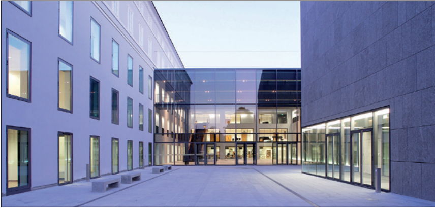
UNIVERSITÄT MOZARTEUM SALZBURG / © Christian Schneider