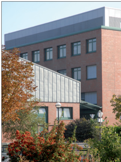
VETERINÄRMEDIZINISCHE UNIVERSITÄT WIEN / © Vetmeduni Vienna/Lengauer

(4) Die tägliche Normalarbeitszeit ist so einzuteilen, dass die wöchentliche Normalarbeitszeit innerhalb eines Durchrechnungszeitraumes von 52 Wochen im Durchschnitt 40 Stunden je Kalenderwoche beträgt. Die wöchentliche Normalarbeitszeit darf innerhalb des Durchrechnungszeitraumes im Durchschnitt 40 Stunden nicht unterschreiten. Die Betrauung mit Lehrtätigkeiten darf nur für Zeiten von Montag bis Freitag zwischen 8 Uhr und 21 Uhr und mit Tätigkeiten in der Patient(inn)enversorgung (ausgenommen Journaldienste und Rufbereitschaften) nur für Zeiten von Montag bis Freitag zwischen 7 Uhr und 20 Uhr erfolgen, sofern nicht durch Betriebsvereinbarung Abweichendes zugelassen wird; Gleiches gilt für ArbeitnehmerInnen der