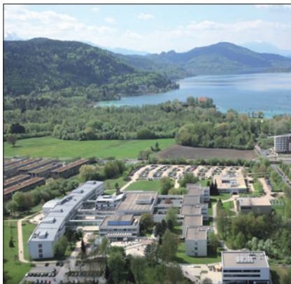
ALPEN-ADRIA-UNIVERSITÄT KLAGENFURT