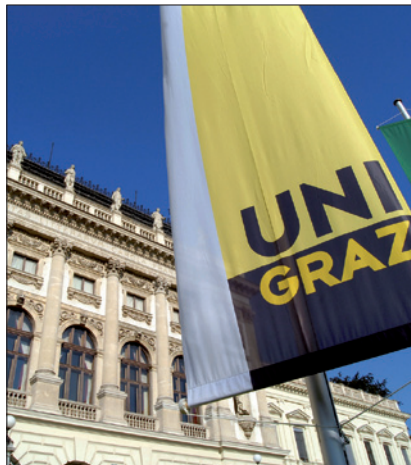
KARL-FRANZENS-UNIVERSITÄT GRAZ / © Uni Graz

(5) Auf Universitätsprofessoren/Universitätsprofessorinnen, die in einem unbefristeten Arbeitsverhältnis stehen, ist unabhängig von Lebensalter und Dienstzeit der § 22 Abs. 3 bis 5 nicht anzuwenden.