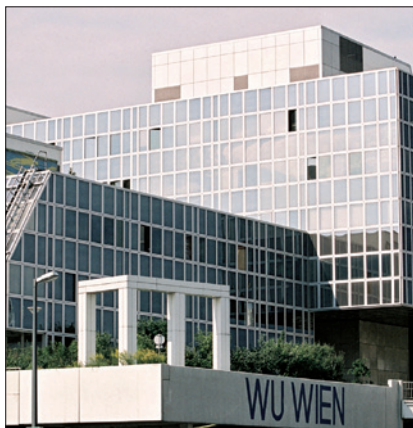
WIRTSCHAFTSUNIVERSITÄT WIEN

(1) Der/die ArbeitnehmerIn ist zu regelmäßiger Fortbildung verpflichtet und hat an von der