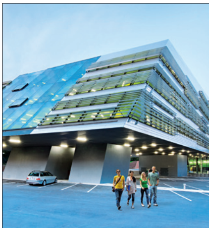
JOHANNES KEPLER UNIVERSITÄT LINZ, SCIENCE PARK / © Hertha Hurnaus

(2) Zeitpunkt und Dauer der Freistellung sind mit der Universität zu vereinbaren. In dieser Vereinbarung sind auch die Ziele der Weiterbildung festzulegen.