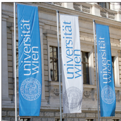
UNIVERSITÄT WIEN, HAUPTPORTAL