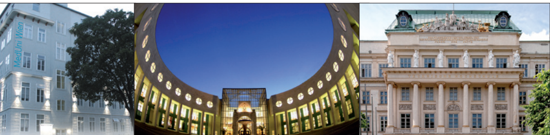
MEDIZINISCHE UNIVERSITÄT WIEN • UNIVERSITÄT SALZBURG • TECHNISCHE UNIVERSITÄT WIEN, HAUPTGEBÄUDE