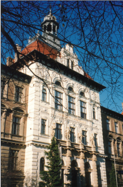
UNIVERSITÄT FÜR BODENKULTUR, MENDEL HAUS