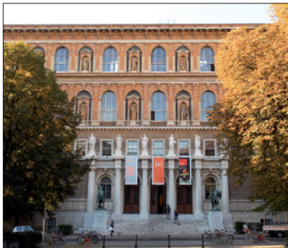
AKADEMIE DER BILDENDEN KÜNSTE WIEN

(2) Als Bruttobezug nach Abs. 1 gilt das jeweilige Entgelt nach §§ 49 bzw. § 54 zuzüglich allfälliger Zulagen nach §§ 57, 59, 60 und 69 sowie der Entschädigungen nach §§ 58 und 70.