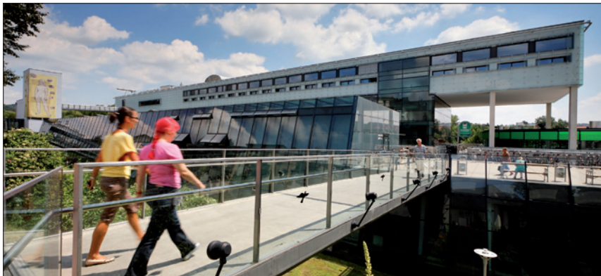
ZENTRUM FÜR MEDIZINISCHE FORSCHUNG (ZMF) DER MEDIZINISCHEN UNIVERSITÄT GRAZ