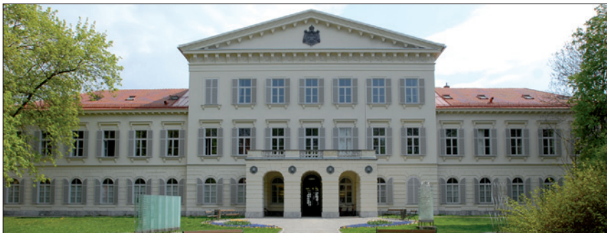
KUNSTUNIVERSITÄT GRAZ, PALAIS MERAN